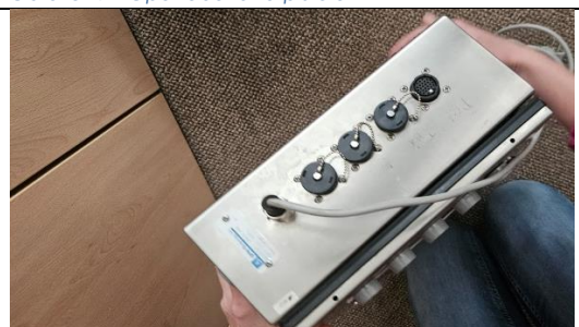
Obrázek 9 - Zadní strana terminálu s konektory