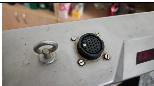
Obrázek 8 - Konektor pro datový kabel (kabel chybí)