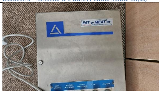
Obrázek 10 - Horní část přístroje

Přístroj je značně opotřeben a chybí zásadní díl – propojovací datový kabel mezi pistolí a terminálem.