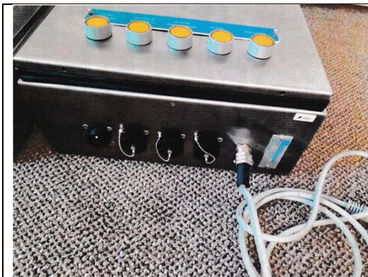
Obrázek 1 - Fotodokumentace pořízená zadavatelem