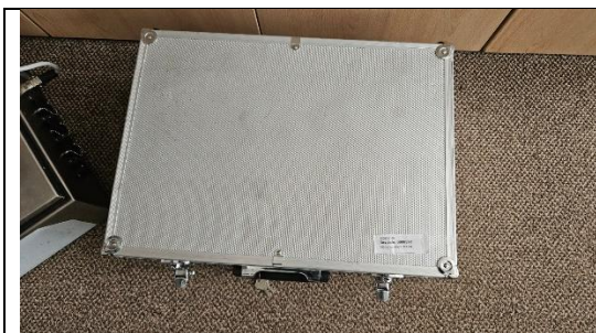
Obrázek 5 - Kufřík na pistolí a příslušenství

Přístroj byl vyroben v Dánsku pod sériovým číslem 411.