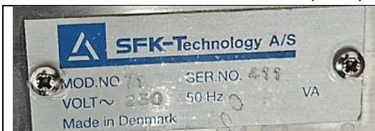
Obrázek 3 - Výrobní štítek přístroje

Při prohlídce dne 9. dubna 2024 byla vytvořena fotodokumentace.