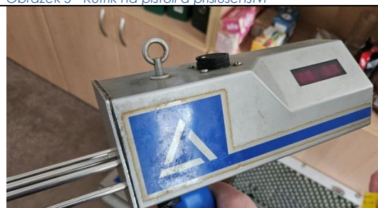
Obrázek 7 - Opatřovaná pistol