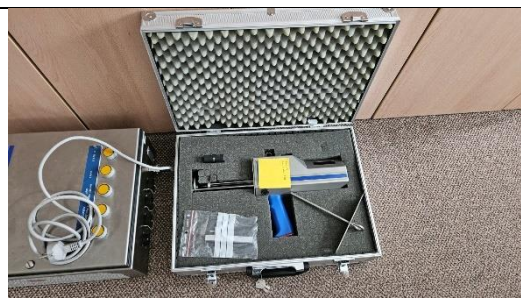
Obrázek 6 - Kufřík s pistolí